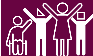
Diversità & Inclusione