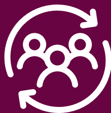
Cambio di processi