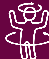
Agilità & Innovazione