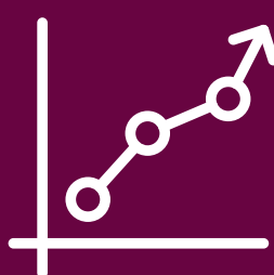
Consulenza Vendita | Acquisti