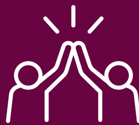
Spirito di squadra