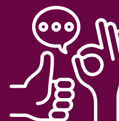
Aumentare l'efficienza √ Comunicazione adattiva